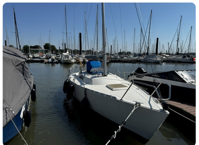
Albin Express 31