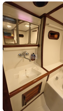
Feltz Alu One Off_60