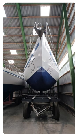
Feltz Alu One Off_2