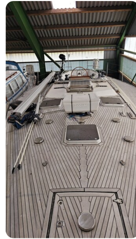
Feltz Alu One Off_15