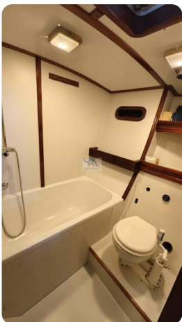
Feltz Alu One Off_58