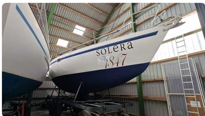
Feltz Alu One Off_1