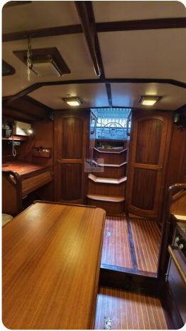
Feltz Alu One Off_48