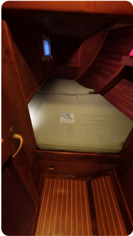
Feltz Alu One Off_73