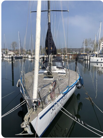
Feltz Alu One Off_111