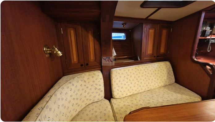
Feltz Alu One Off_52