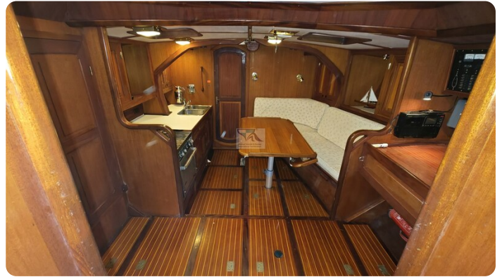
Feltz Alu One Off_39