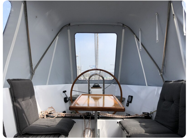
Feltz Alu One Off_89