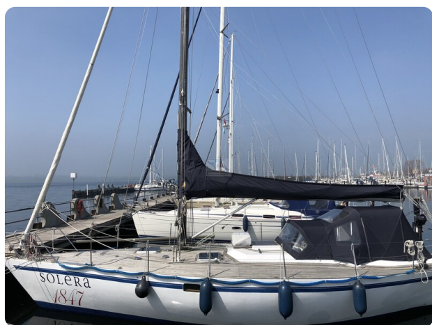
Feltz Alu One Off_113