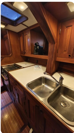
Feltz Alu One Off_66