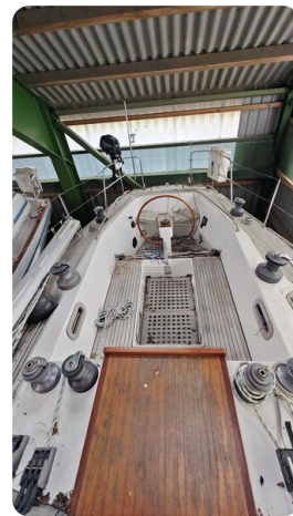
Feltz Alu One Off_27