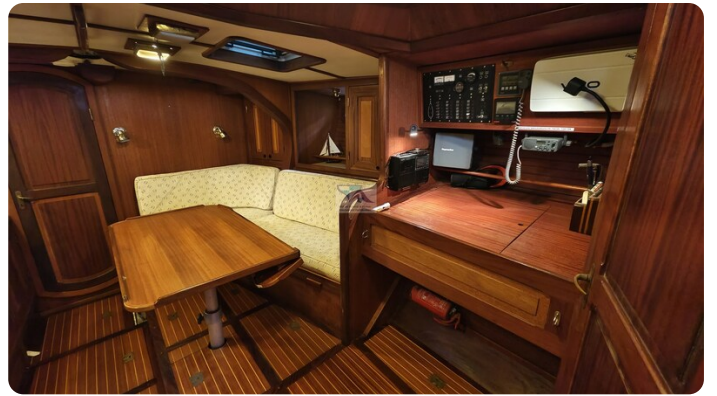
Feltz Alu One Off_42