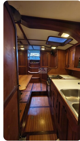
Feltz Alu One Off_61