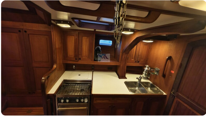
Feltz Alu One Off_53