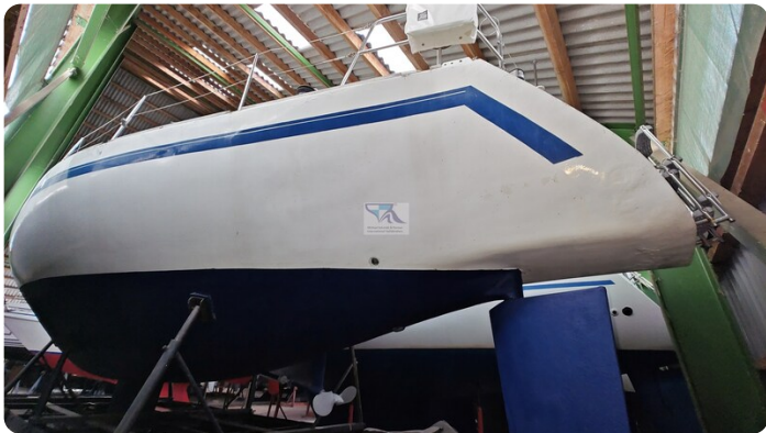
Feltz Alu One Off_8