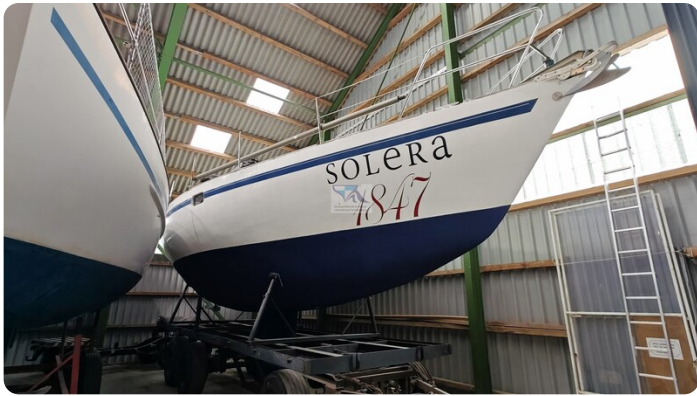
Feltz Alu One Off_1