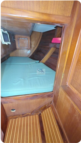
Feltz Alu One Off_77