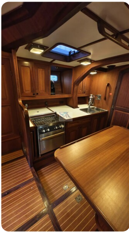
Feltz Alu One Off_44