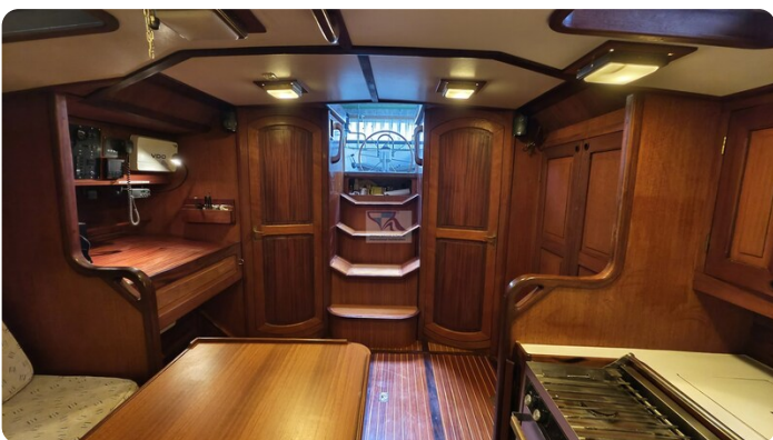
Feltz Alu One Off_49