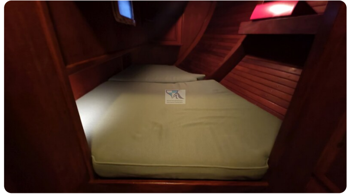
Feltz Alu One Off_75