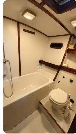
Feltz Alu One Off_58