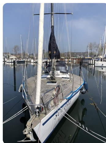
Feltz Alu One Off_111