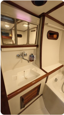
Feltz Alu One Off_60