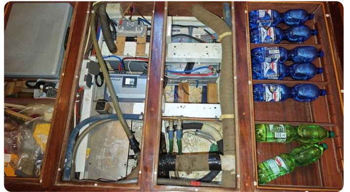
Feltz Alu One Off_68