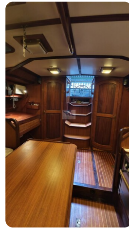
Feltz Alu One Off_48