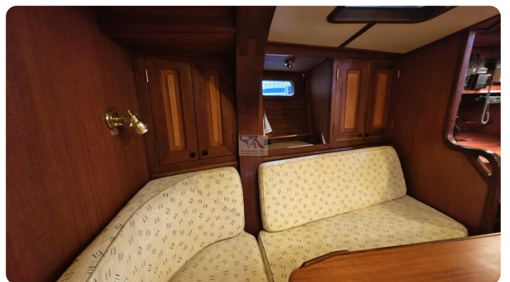
Feltz Alu One Off_52