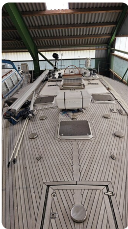
Feltz Alu One Off_15