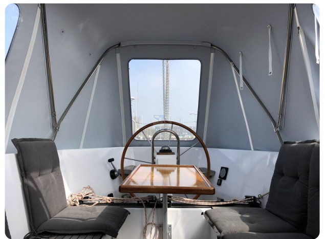
Feltz Alu One Off_89