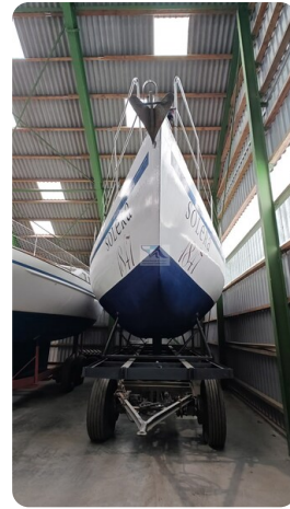
Feltz Alu One Off_2