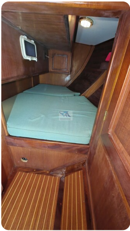
Feltz Alu One Off_76