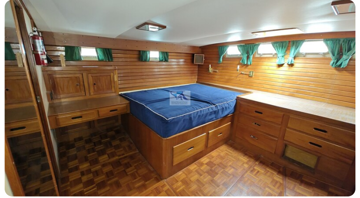
Grand Banks 48_msp789980 48