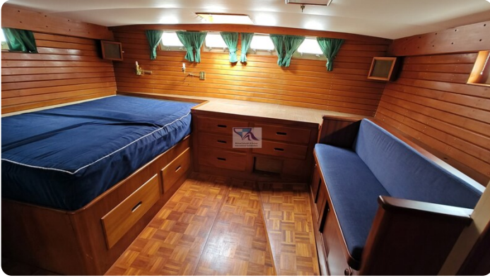
Grand Banks 48_msp789980 50