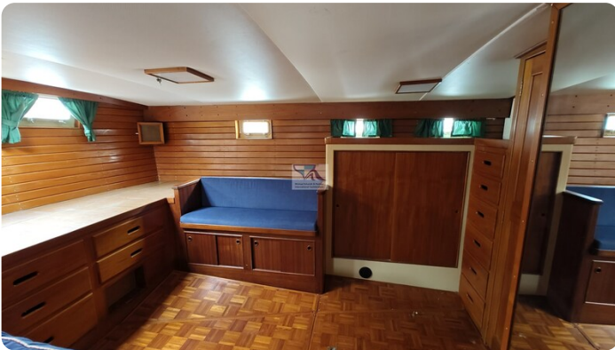
Grand Banks 48_msp789980 51