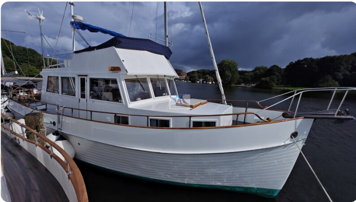
Grand Banks 48_msp789980 66