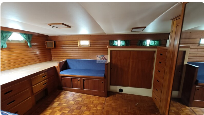
Grand Banks 48_msp789980 51