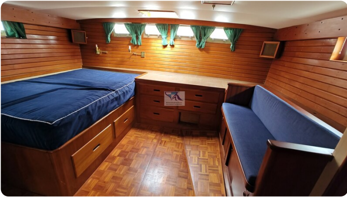
Grand Banks 48_msp789980 50