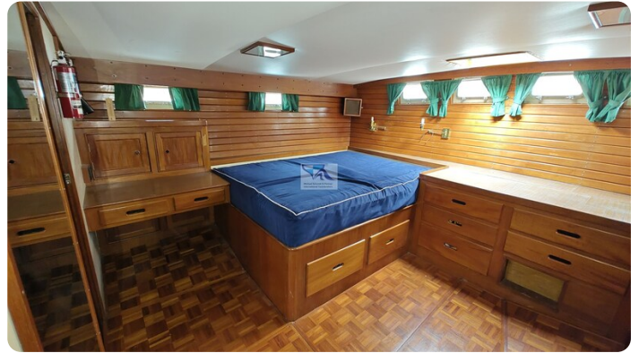
Grand Banks 48_msp789980 48