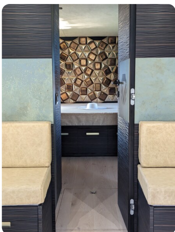
Apex 60 interiors