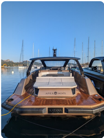
Apex 60 stern view