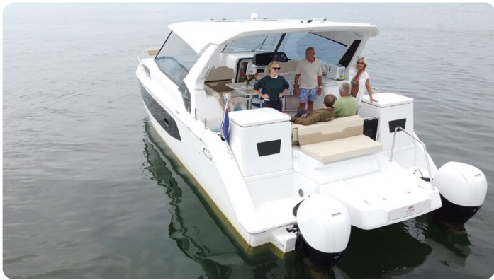
Aquila 36 Sport aft view