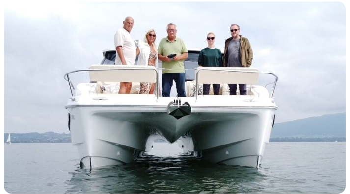
Aquila 36 Sport bow view