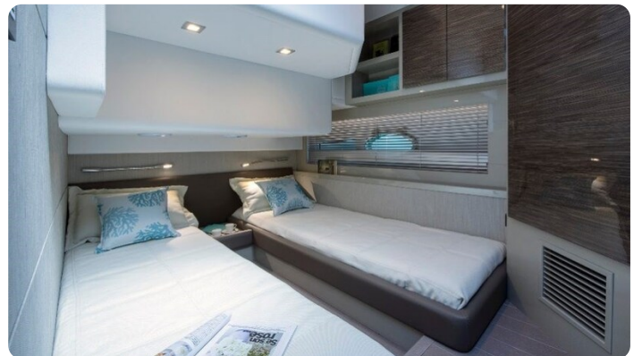
AP 44 Sedan guest cabin