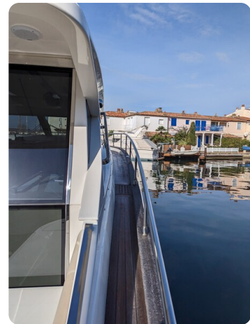
AP 44 Sedan sideways