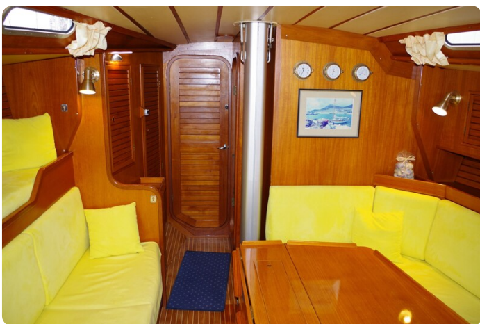
Avance 40 msp636285 13