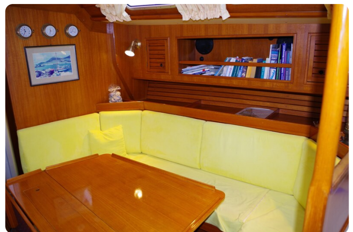
Avance 40 msp636285 14