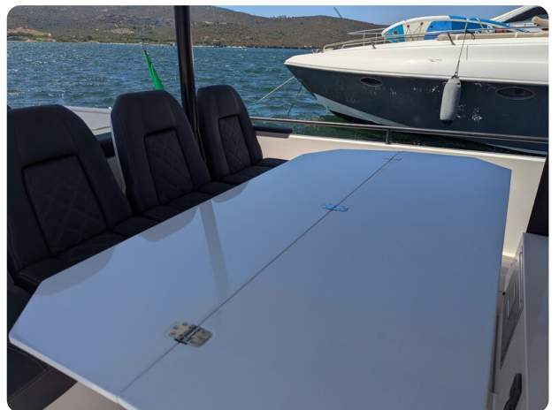
Axopar 37 Sun Top Brabus, table detail