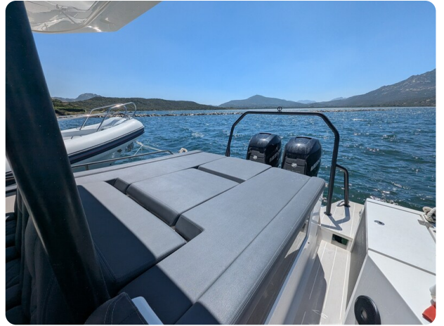
Axopar 37 Sun Top Brabus, aft sunpad