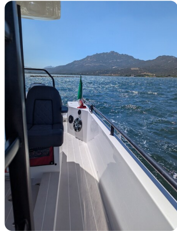
Axopar 37 Sun Top Brabus, side view