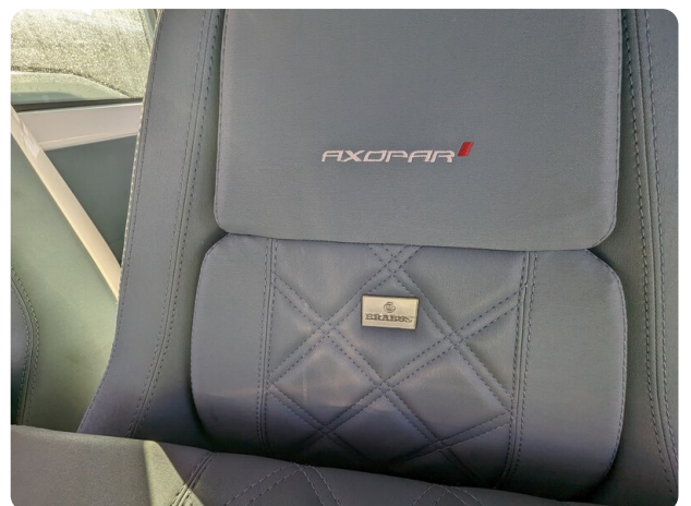
Axopar 37 XC details