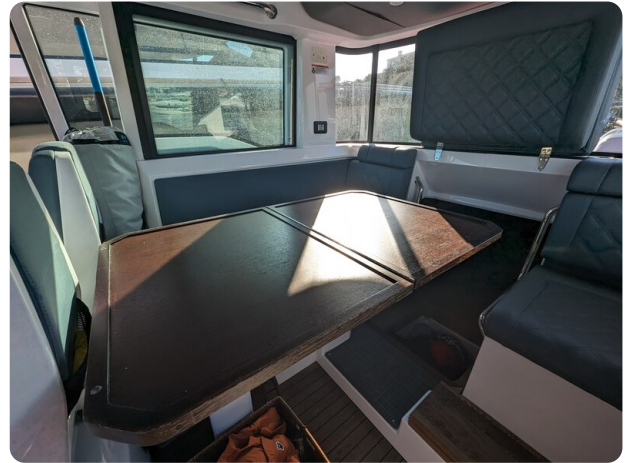
Axopar 37 XC dinette