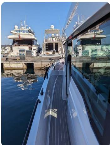
Axopar 37 XC side ways