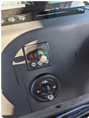
Axopar 37 XC bow thruster