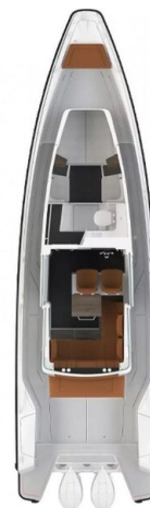
Axopar 37XC layout