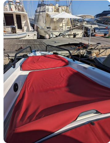
Axopar 37 XC bow deck