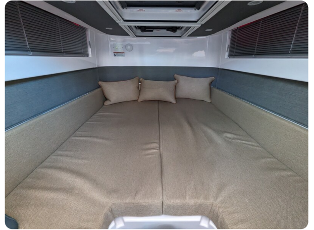
Axopar 37 XC aft cabin