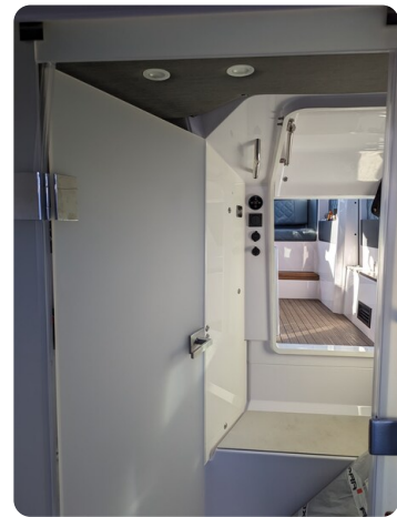
Axopar 37 XC cabin entrance