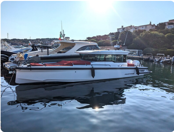
Axopar 37 XC profile