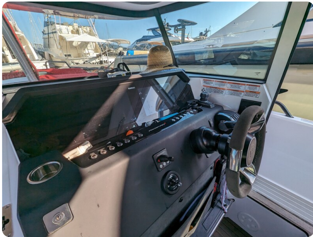
Axopar 37 XC helm