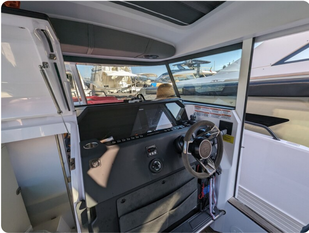
Axopar 37 XC helm station