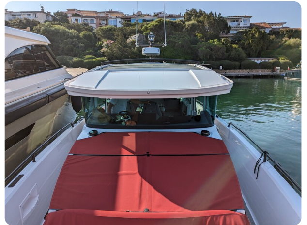
Axopar 37 XC bow detail