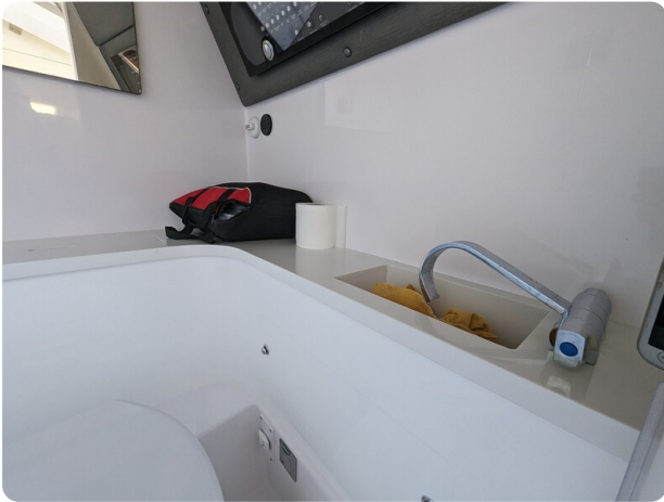
Axopar 37 XC bathroom