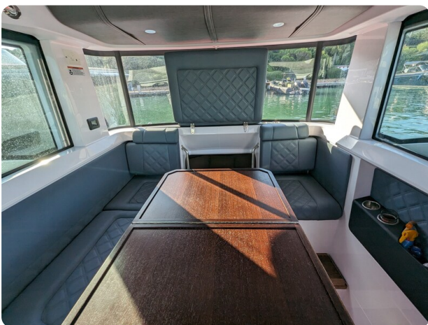
Axopar 37 XC dinette view