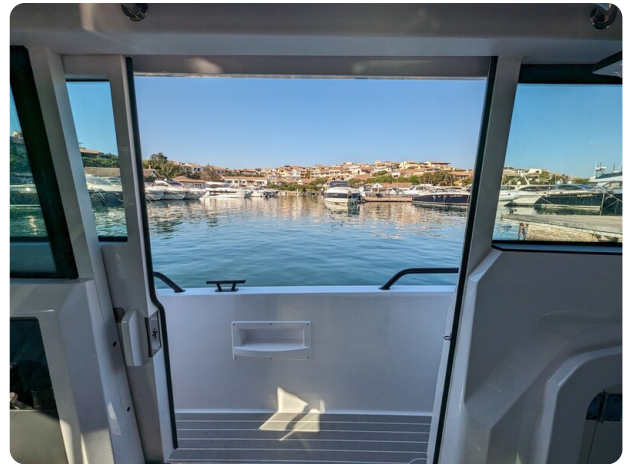
Axopar 37 XC side door