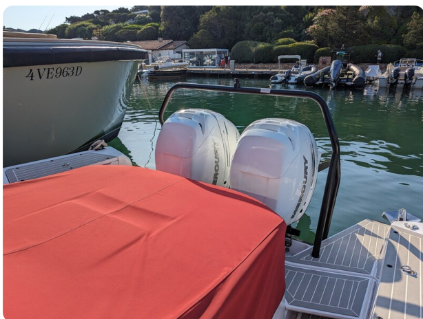
Axopar 37 XC cockpit