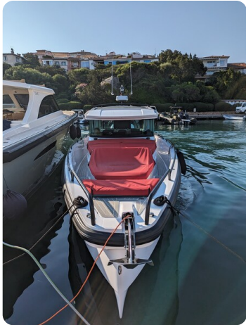
Axopar 37 XC bow view