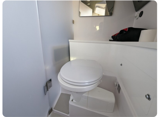
Axopar 37 XC head