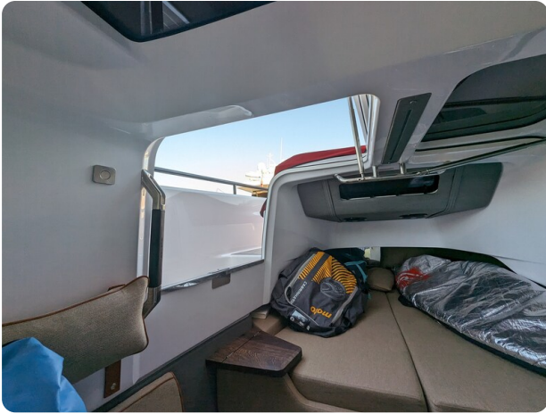
Axopar 37 XC cabin side door