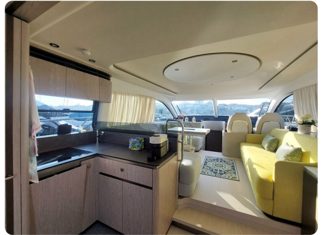
Azimut 53 Fly El Bibes-36