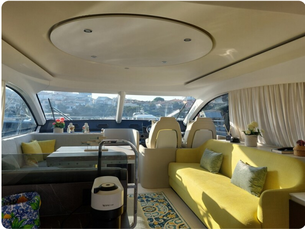
Azimut 53 Fly El Bibes-16