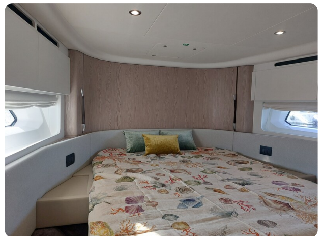
Azimut 53 Fly vip cabin