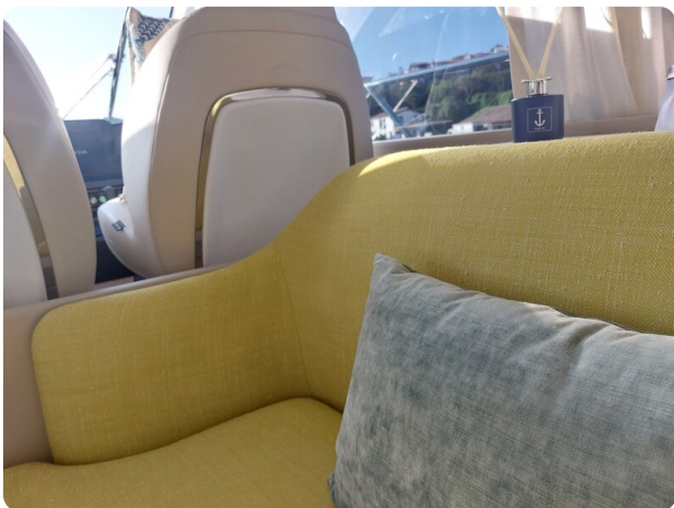
Azimut 53 Fly El Bibes-13