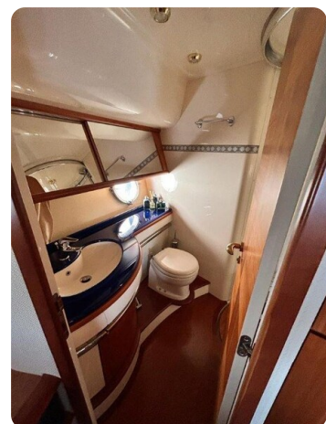
Az 62 Bagno cabina Vip prua