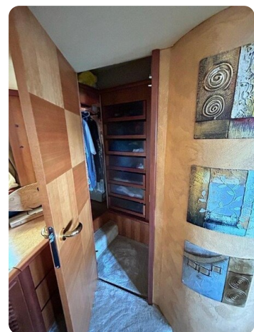
Az 62 Cabina armadio - cabina armatore