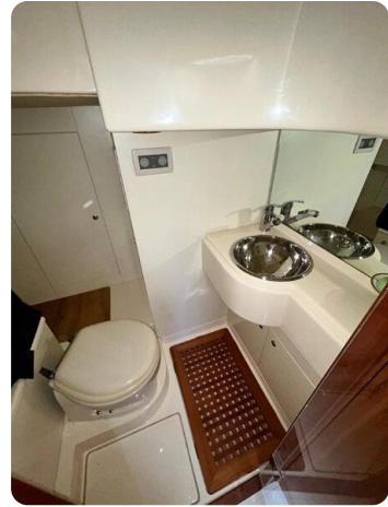
Az 62 Bagno cabina marinaio