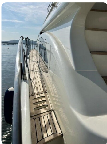
Az 62 Vista camminamento laterale