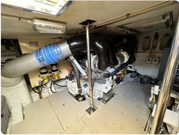
Az 62 Sala macchine.1