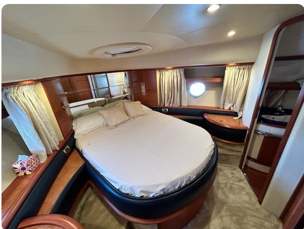
Az 62 Cabina VIP