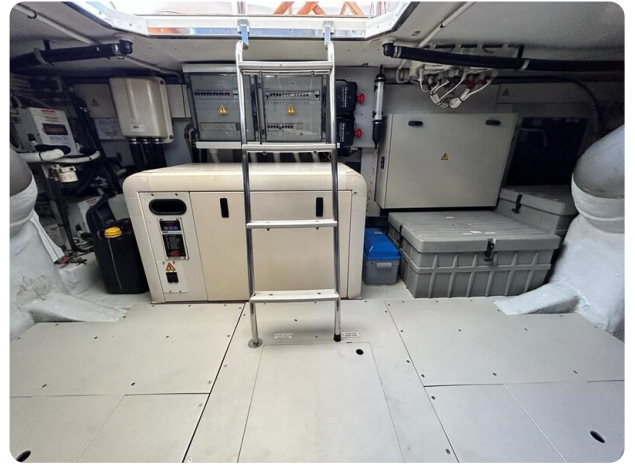
Az 62 Sala macchine - vista generatore