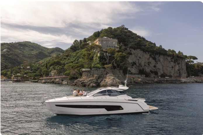
A45 Exterior View 1