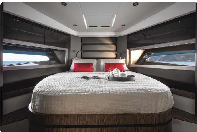
A45 Master Cabin