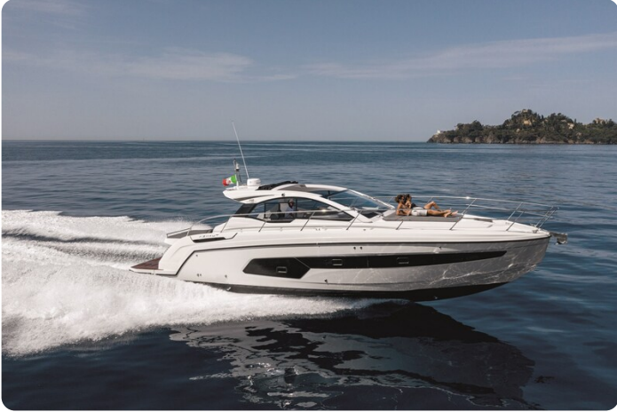
A45 Running 4