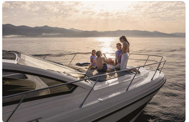
A45 Exterior View 3