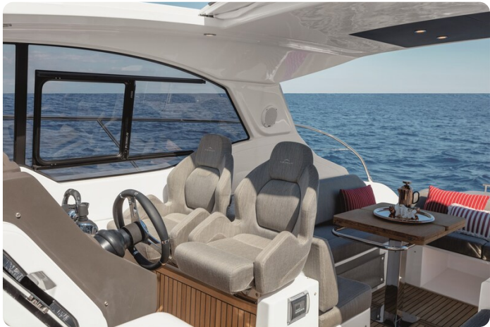
A45 Helmstation Seats