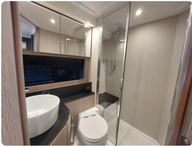
Azimut Atlantis 45 bathroom