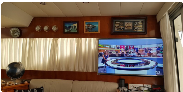
{1} Salon detail