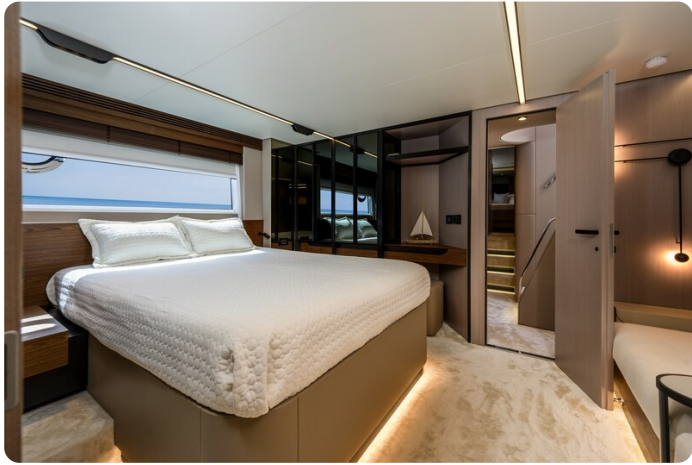
Azimut S7New, owner's cabin