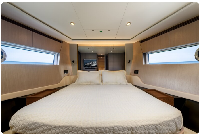
Azimut S7New Vip cabin