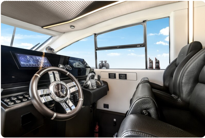
Azimut S7New helm station