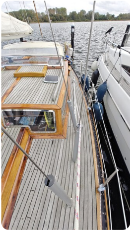
Baltika Decksalon SY 10