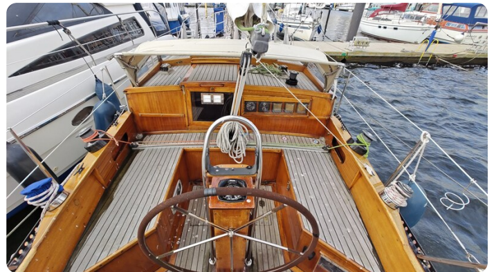
Baltika Decksalon SY 14