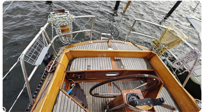
Baltika Decksalon SY 12