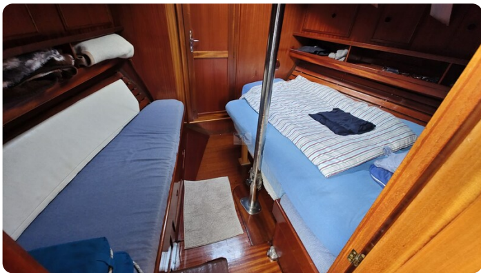
Baltika Decksalon SY 24