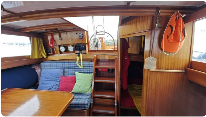
Baltika Decksalon SY 18