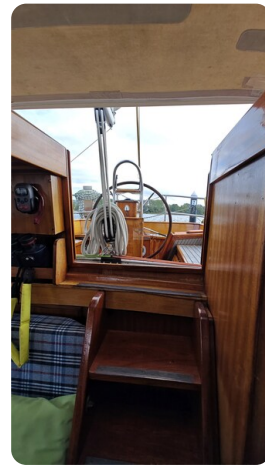
Baltika Decksalon SY 32