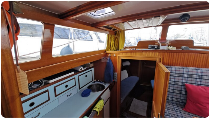
Baltika Decksalon SY 21