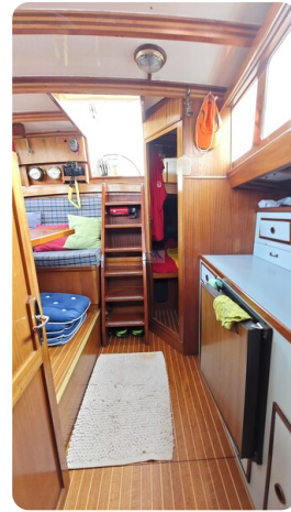
Baltika Decksalon SY 27