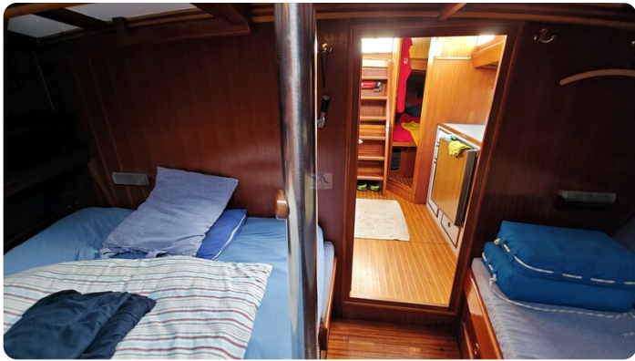
Baltika Decksalon SY 26