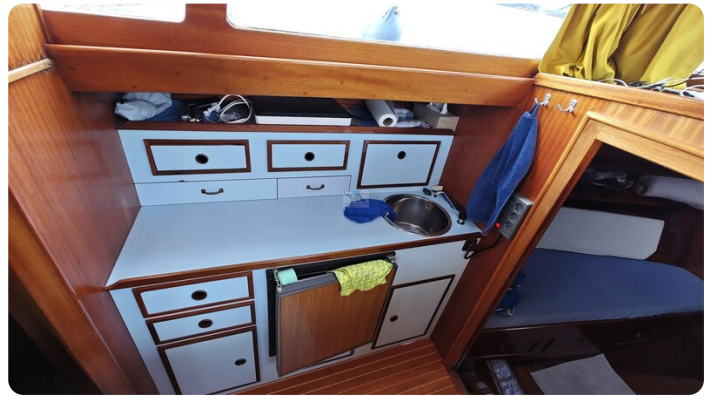
Baltika Decksalon SY 22