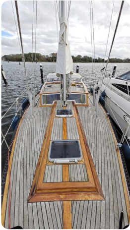
Baltika Decksalon SY 6