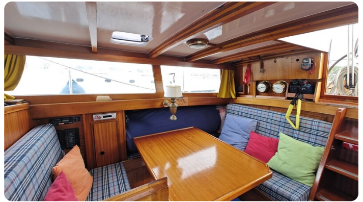
Baltika Decksalon SY 19