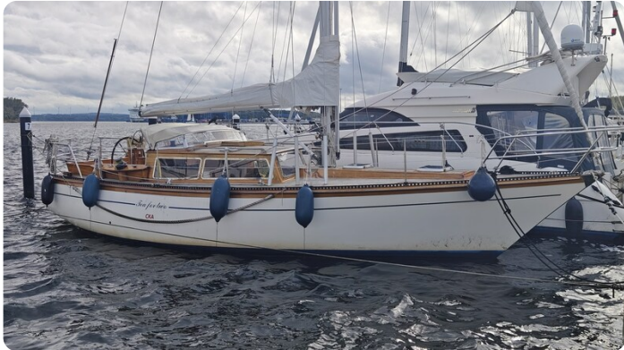
Baltika Decksalon SY 2