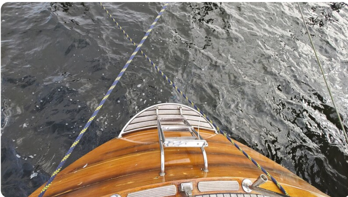
Baltika Decksalon SY 13