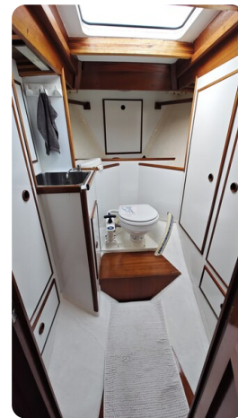
Baltika Decksalon SY 25