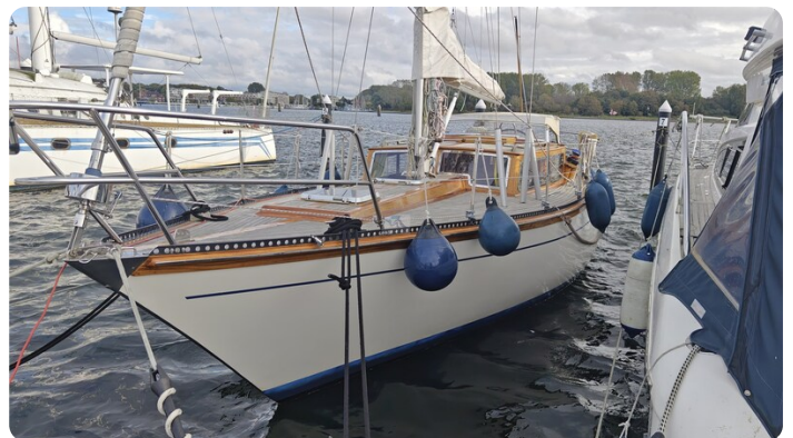
Baltika Decksalon SY 4