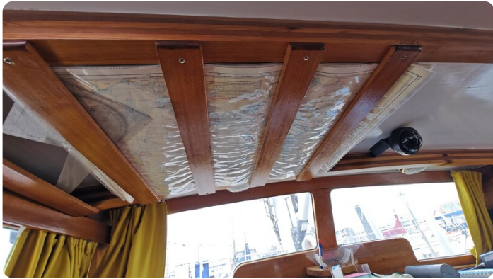
Baltika Decksalon SY 29