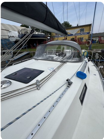
Bavaria 32 Cruiser HERON 63