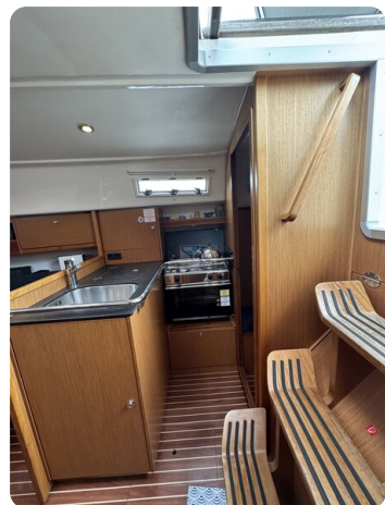
Bavaria 32 Cruiser HERON 40