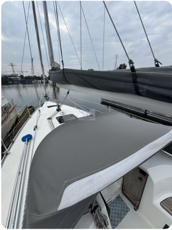
Bavaria 32 Cruiser HERON 61