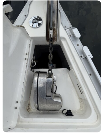
Bavaria 32 Cruiser HERON 68