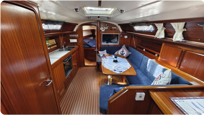
Bavaria 37_msp 11