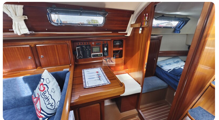
Bavaria 37_msp 15