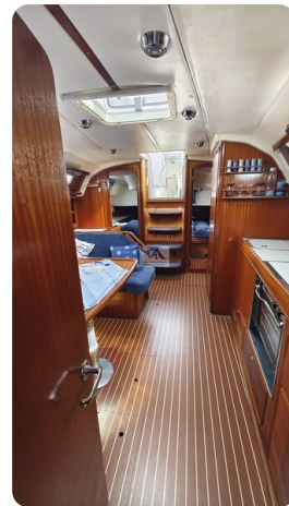
Bavaria 37_msp 24