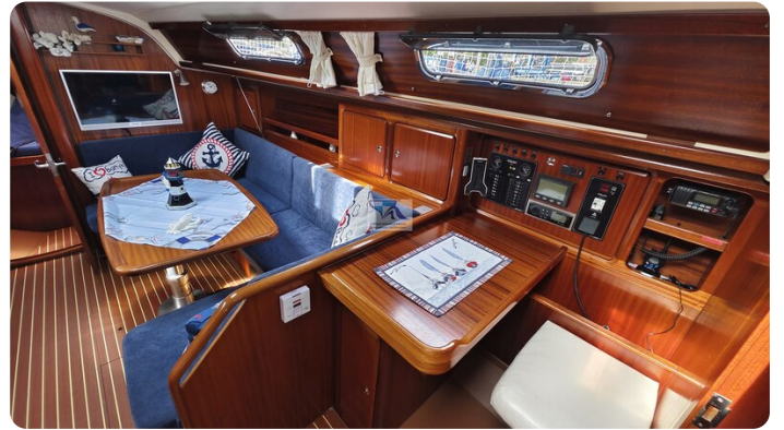
Bavaria 37_msp 12