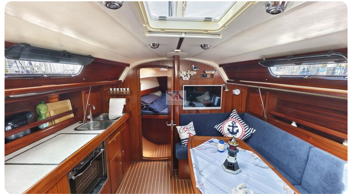
Bavaria 37_msp 20