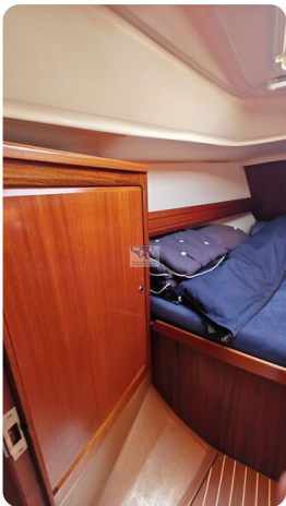
Bavaria 37_msp 23