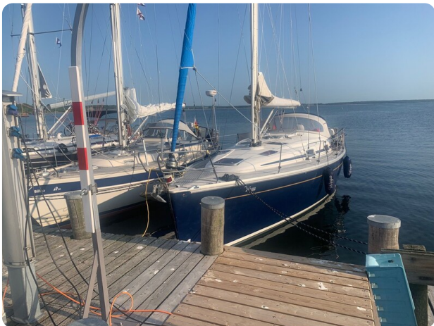
Bavaria 37 msp749314 2