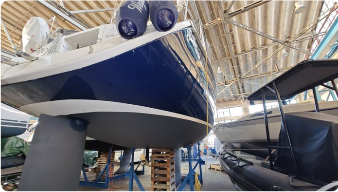
Bavaria 37 msp749314 6