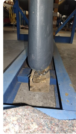
Bavaria 37 msp749314 7