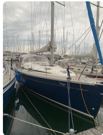
Bavaria 37 msp749314 3