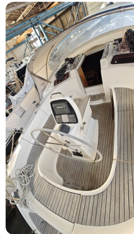
Bavaria 37 msp749314 8