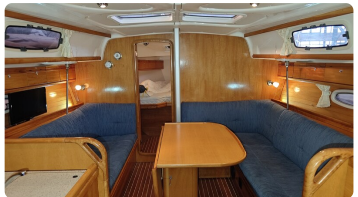
Bavaria 37 msp749314 12