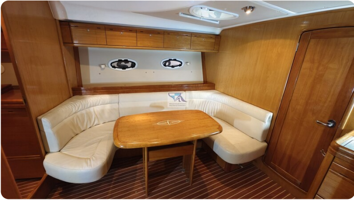
Bavaria 37 Sport msp793423 52