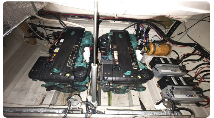
Bavaria 37 Sport msp793423 36