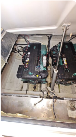
Bavaria 37 Sport msp793423 41