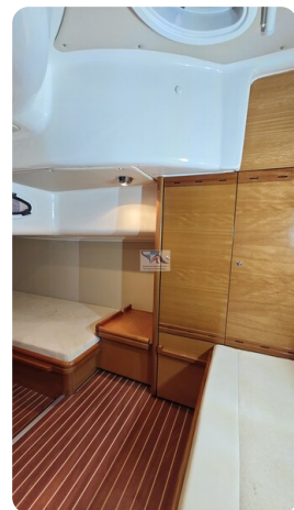
Bavaria 37 Sport msp793423 49