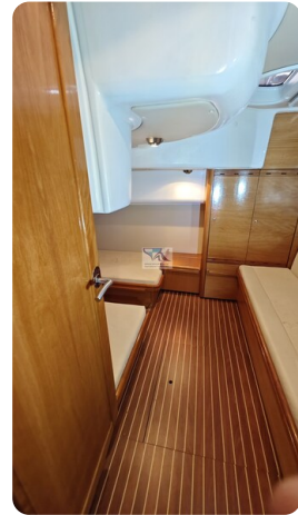
Bavaria 37 Sport msp793423 47