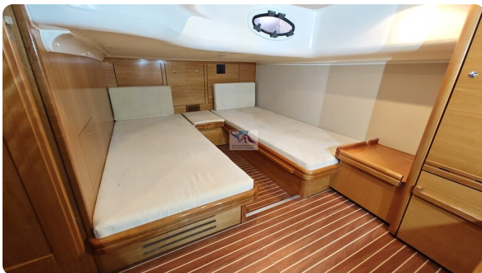
Bavaria 37 Sport msp793423 48