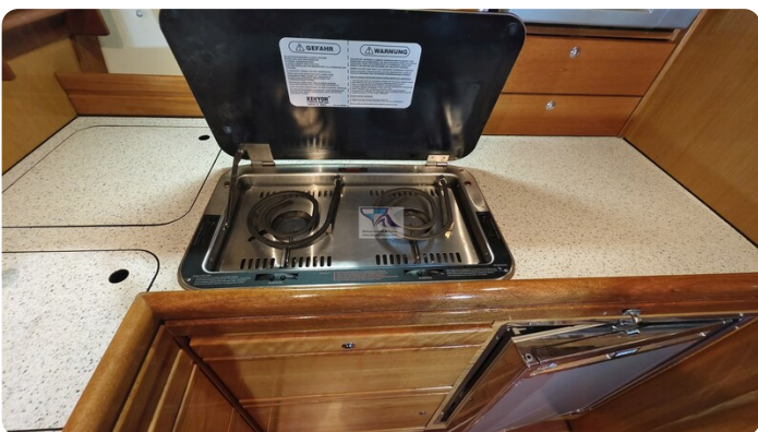
Bavaria 37 Sport msp793423 68