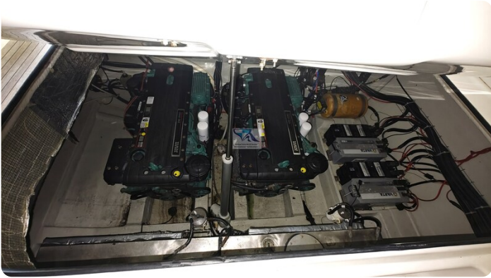
Bavaria 37 Sport msp793423 35