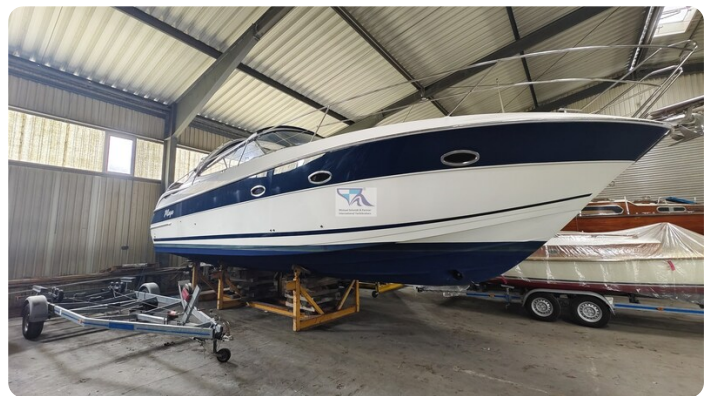
Bavaria 37 Sport msp793423 4