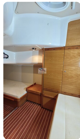
Bavaria 37 Sport msp793423 49