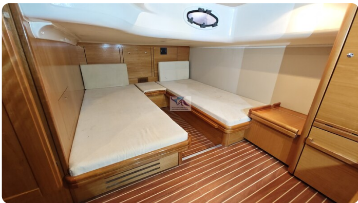
Bavaria 37 Sport msp793423 48