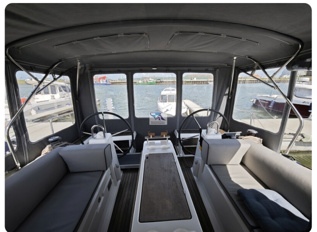
Oceanis 35.1 76