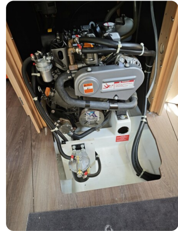
Oceanis 35.1 43