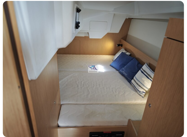
Oceanis 35.1 37