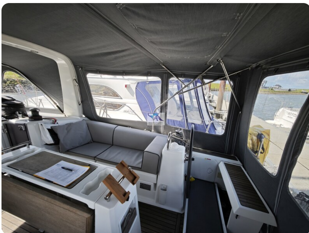
Oceanis 35.1 71