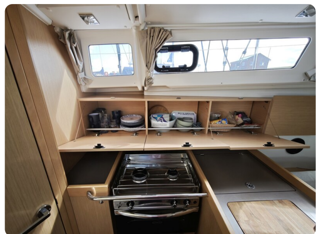
Oceanis 35.1 21