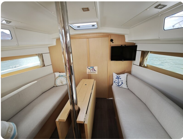
Oceanis 35.1 15