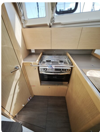
Oceanis 35.1 20