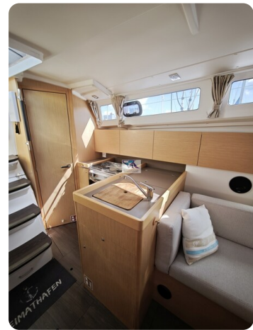
Oceanis 35.1 18