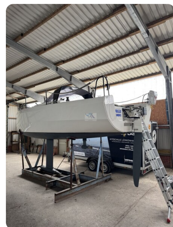
Bente 24 MUGGEL 3