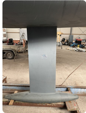
Bente 24 MUGGEL 7