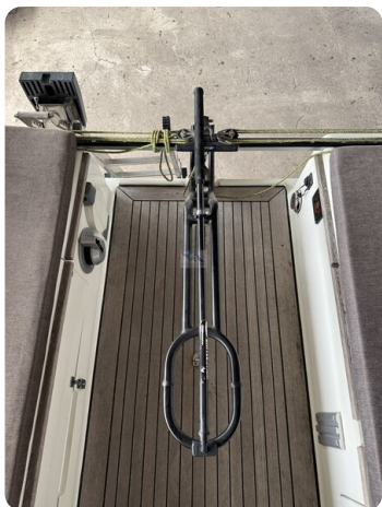
Bente 24 MUGGEL 16