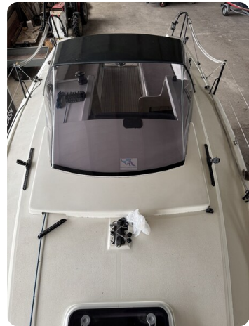
Bente 24 MUGGEL 27