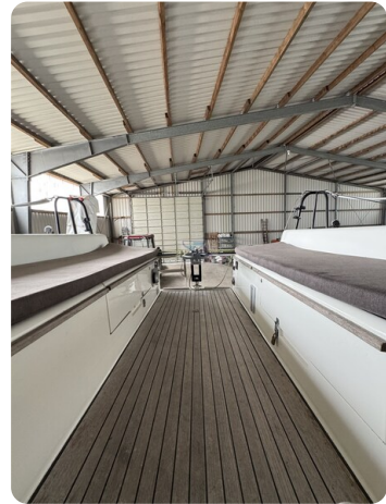
Bente 24 MUGGEL 25