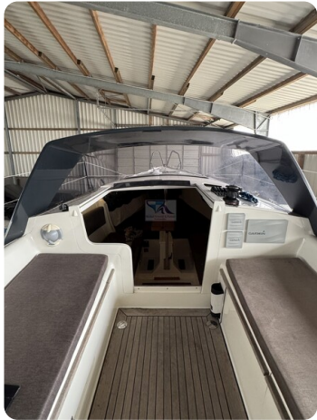
Bente 24 MUGGEL 15