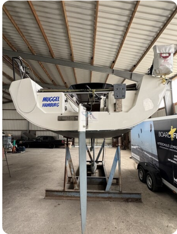
Bente 24 MUGGEL 4