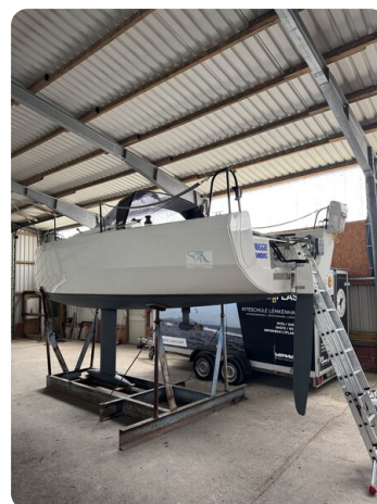
Bente 24 MUGGEL 3