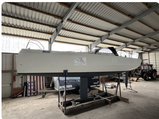
Bente 24 MUGGEL 13