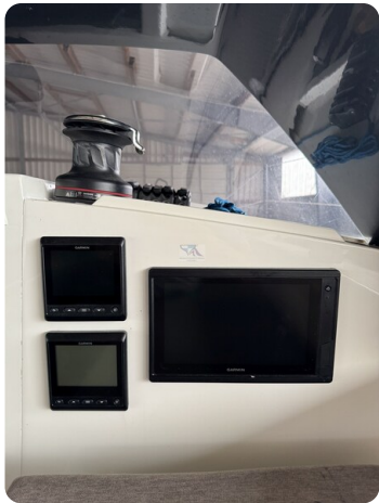
Bente 24 MUGGEL 21