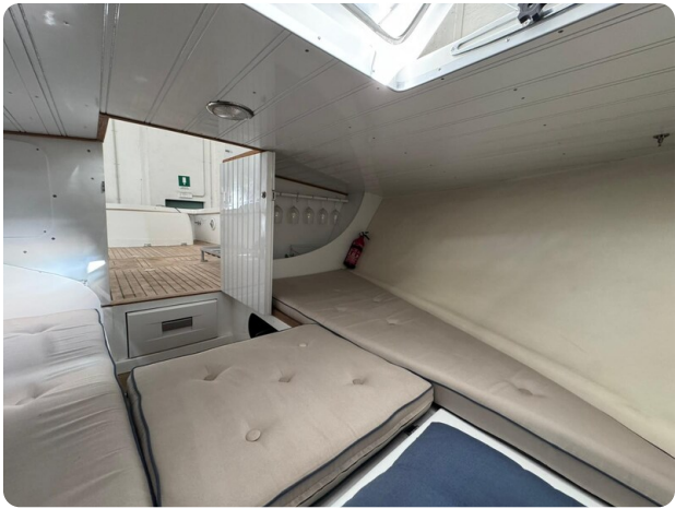
{1} Cabin detail