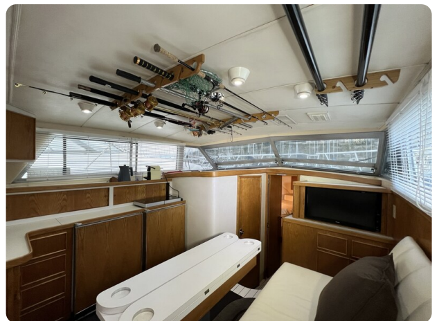
Bertram 33 Sport Fisherman8