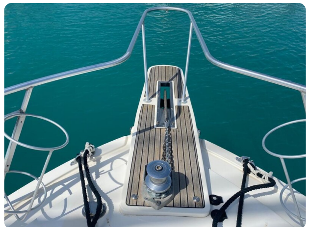
Bertram 37, bow pulpit