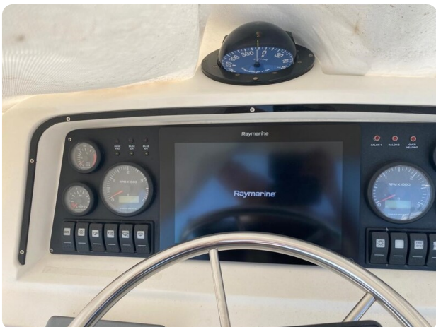
Bertram 37, electronics