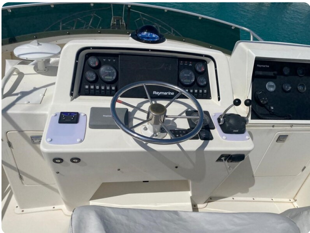
Bertram 37, Fly helm