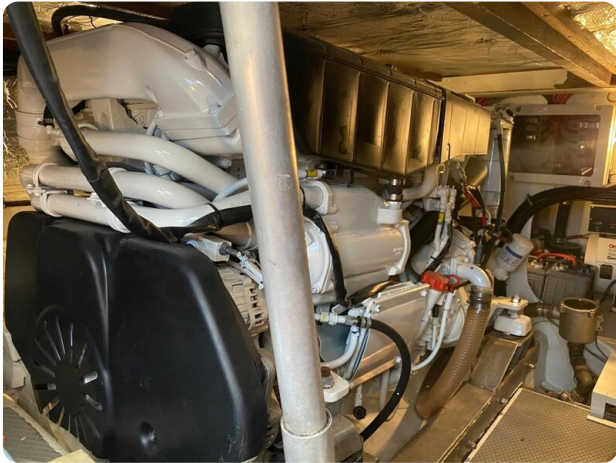
Bertram 37, engine detail