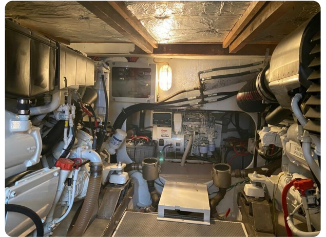
Bertram 37, engine room