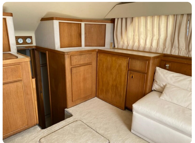
{1} salon detail