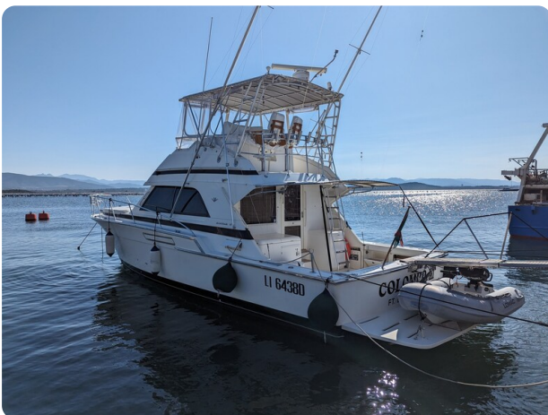
Bertram 43 Conv. profile