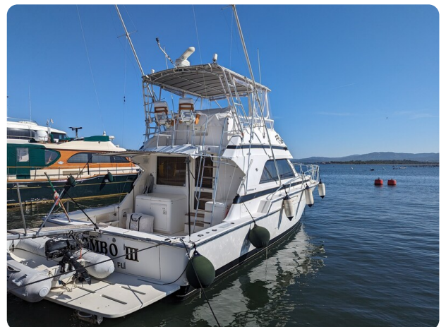
Bertram 43 Conv. aft profile