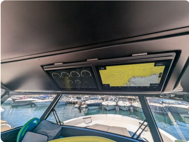
Bluegame 42 electronics