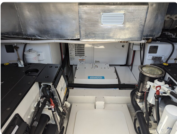
Bluegame 42 Onan generator