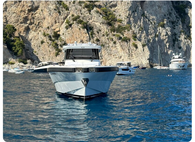
Bluegame 42 bow