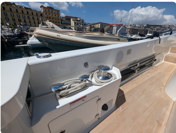
Bluegame 42 cockpit winches