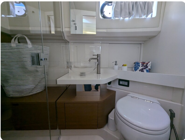
Bluegame 42 bathroom