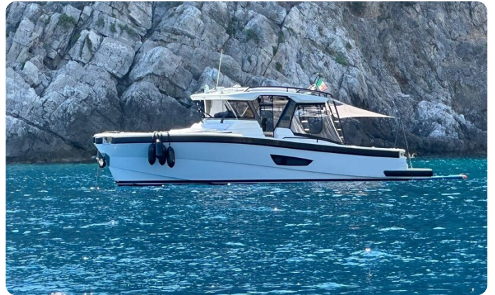
Bluegame 42 profile anchored 2