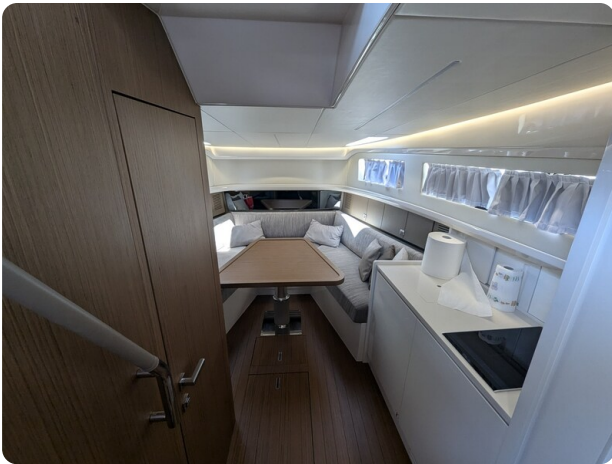
Bluegame 42 interiors