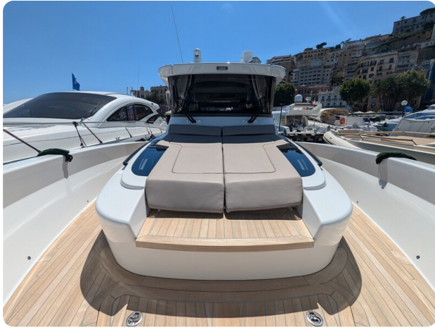
Bluegame 42 bow deck