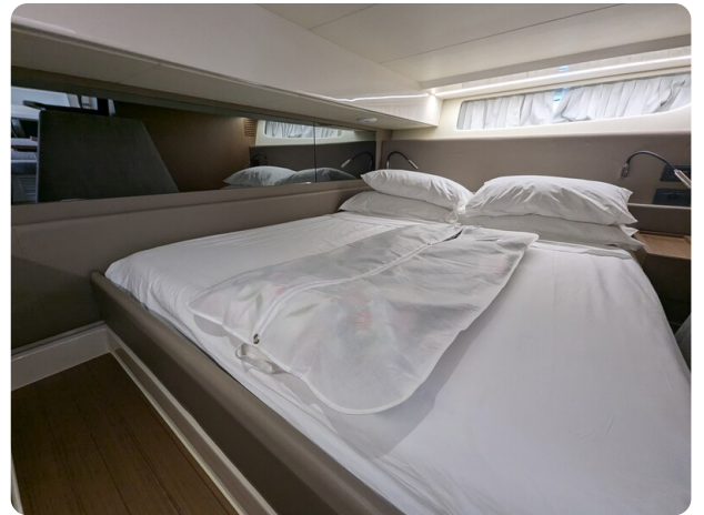
Bluegame 42 aft cabin