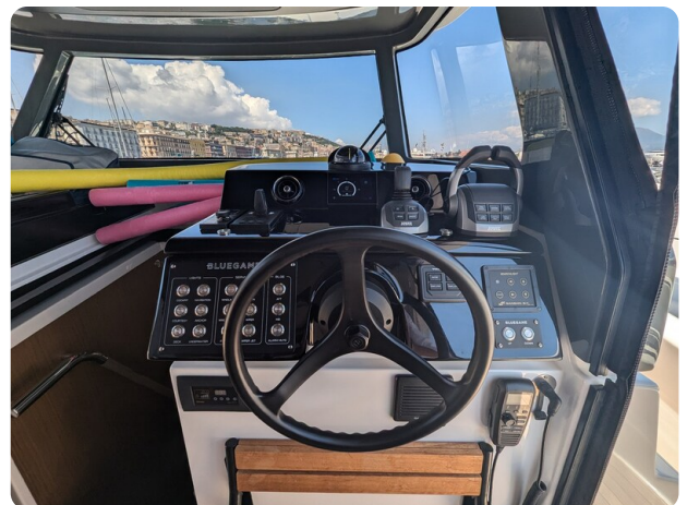
Bluegame 42 helm station