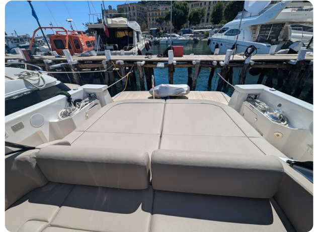
Bluegame 42 cockpit sunpad