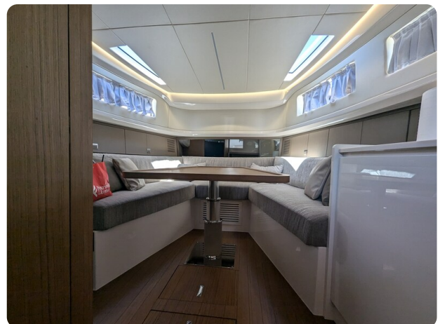
Bluegame 42 conv. dinette