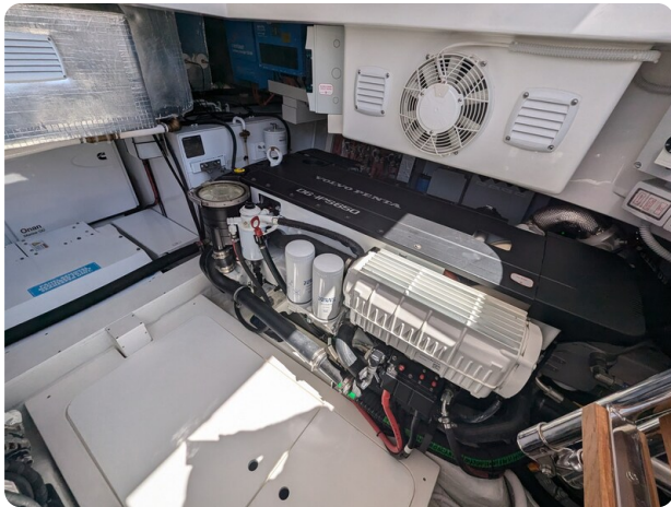
Bluegame 42 stbd engine