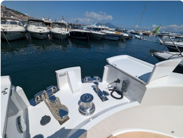
Bluegame 42 windlass detail