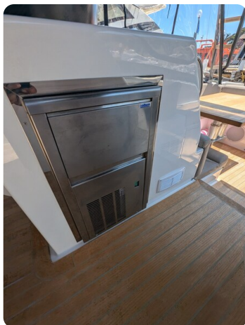
Bluegame 42 cockpit ice maker