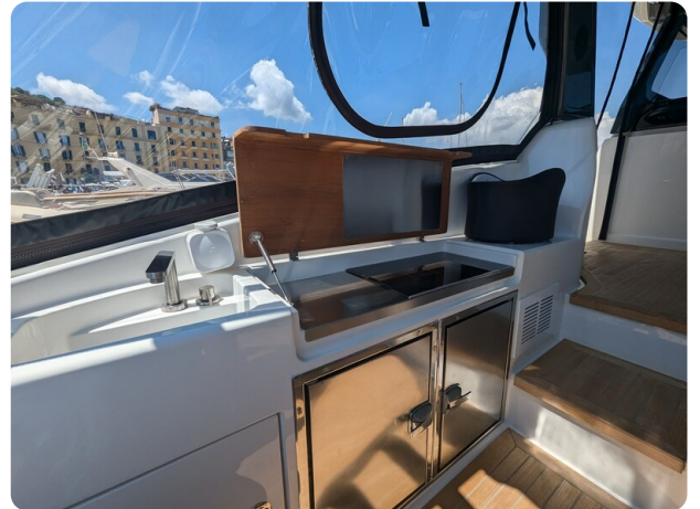
Bluegame 42 cockpit galley