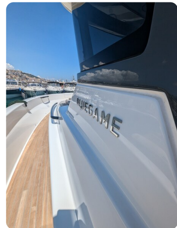
Bluegame 42 sideways detail