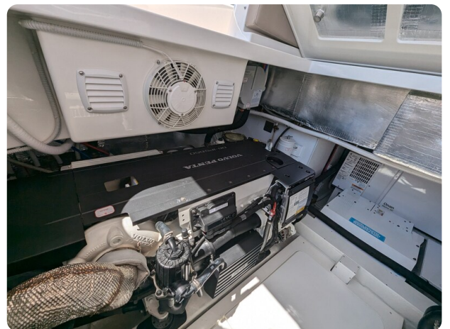
Bluegame 42 port engine