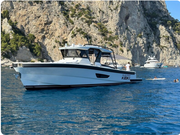
Bluegame 42 bow profile