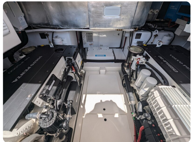
Bluegame 42 engine room