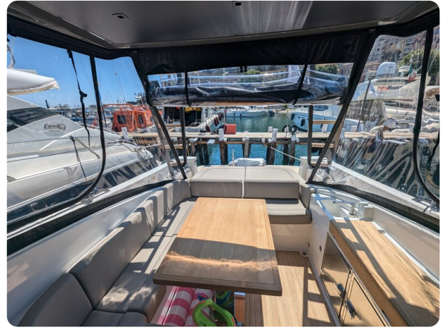
Bluegame 42 cockpit dinette