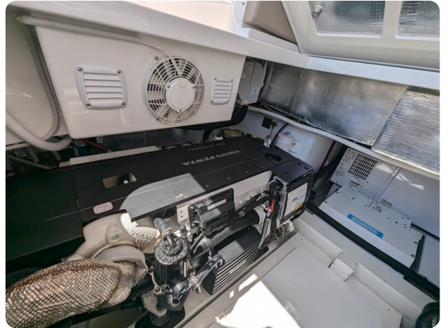
{1} Port engine