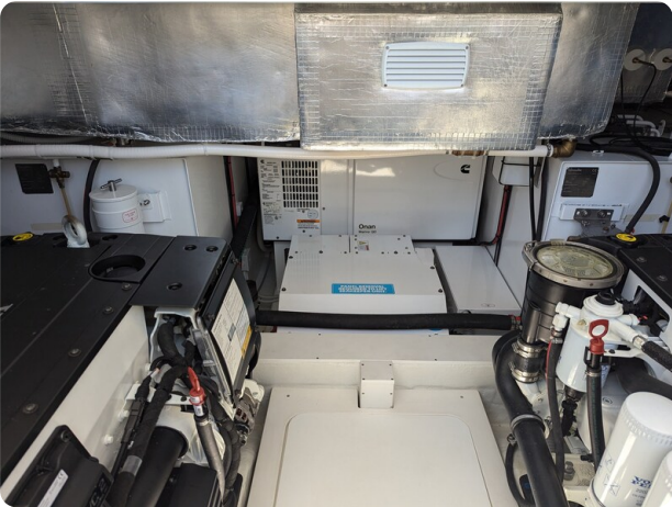
{1} Onan generator