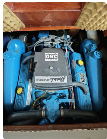
Boesch 590 Cabrio Deluxe CARPE DIEM 25