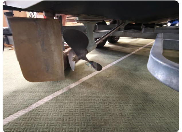
Boesch 590 Cabrio Deluxe CARPE DIEM 37