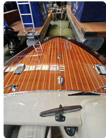
Boesch 590 Cabrio Deluxe CARPE DIEM 18