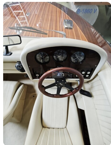
Boesch 590 Cabrio Deluxe CARPE DIEM 15