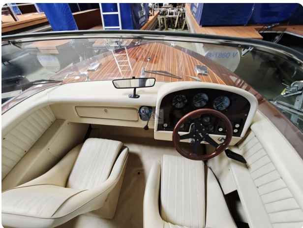
Boesch 590 Cabrio Deluxe CARPE DIEM 17