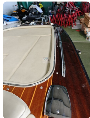
Boesch 590 Cabrio Deluxe CARPE DIEM 28