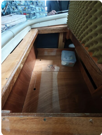
Boesch 590 Cabrio Deluxe CARPE DIEM 39