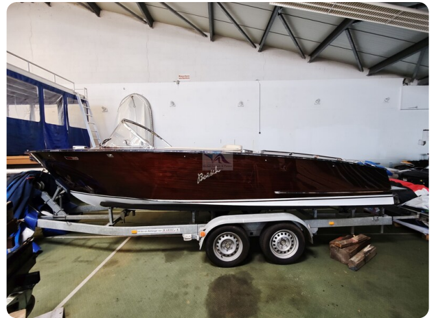
Boesch 590 Cabrio Deluxe CARPE DIEM 31