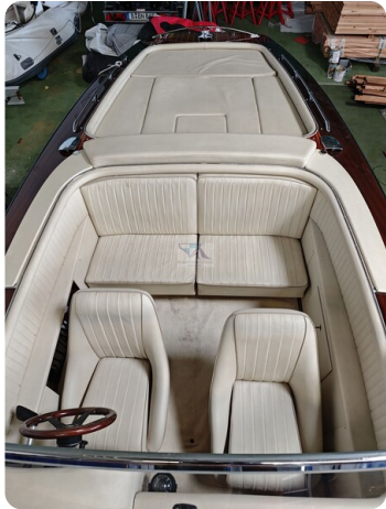
Boesch 590 Cabrio Deluxe CARPE DIEM 21