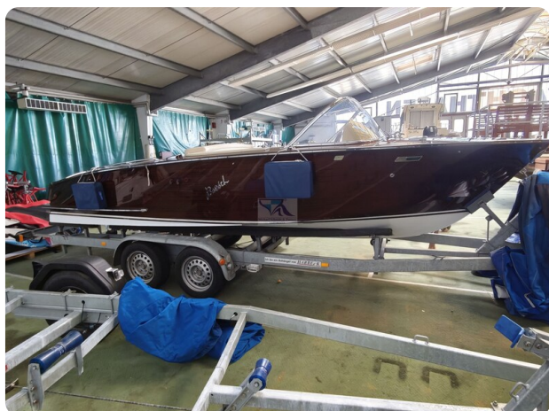
Boesch 590 Cabrio Deluxe CARPE DIEM 35