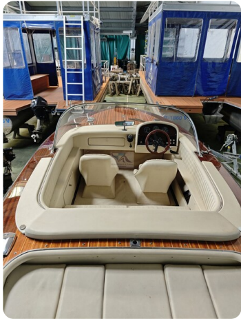
Boesch 590 Cabrio Deluxe CARPE DIEM 12