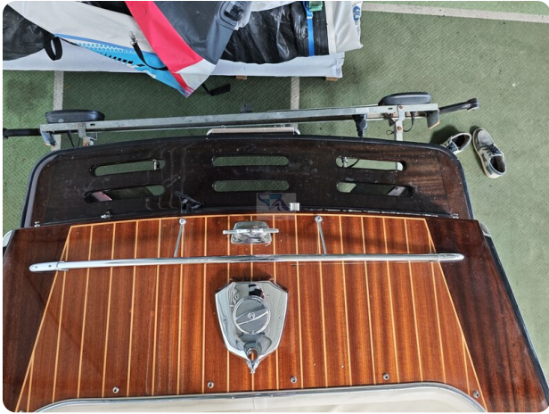
Boesch 590 Cabrio Deluxe CARPE DIEM 30