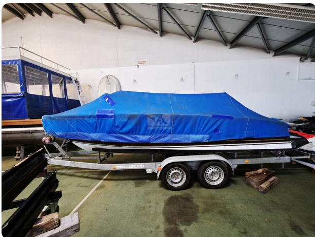
Boesch 590 Cabrio Deluxe CARPE DIEM 11