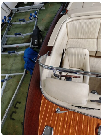
Boesch 590 Cabrio Deluxe CARPE DIEM 22