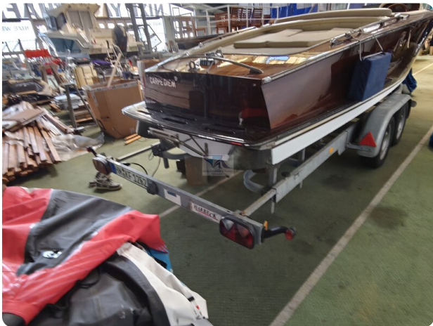
Boesch 590 Cabrio Deluxe CARPE DIEM 36