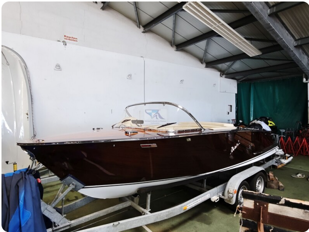
Boesch 590 Cabrio Deluxe CARPE DIEM 32