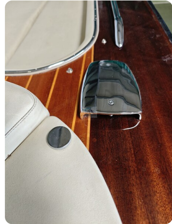
Boesch 590 Cabrio Deluxe CARPE DIEM 27