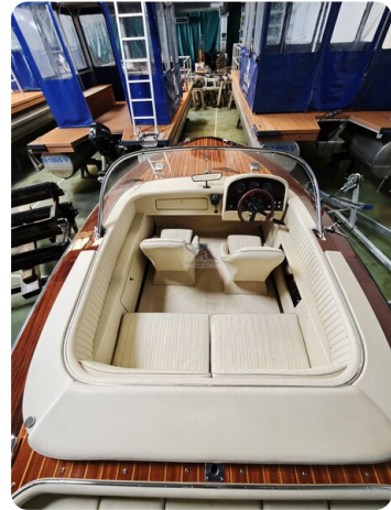
Boesch 590 Cabrio Deluxe CARPE DIEM 14