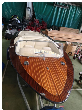
Boesch 590 Cabrio Deluxe CARPE DIEM 34