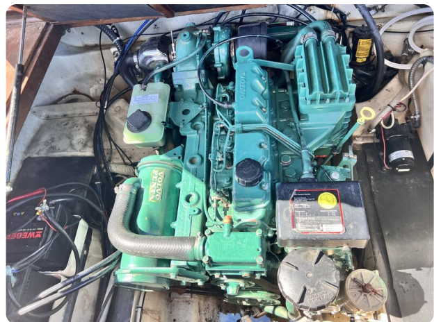
Boston Whaler 22 REVENGE engine