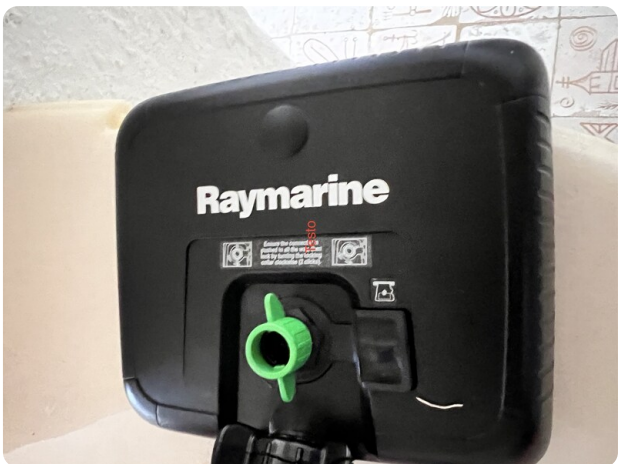
Boston Whaler 22 REVENGE Raymarine