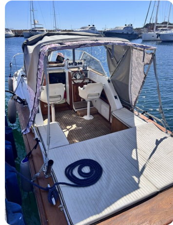
Boston Whaler 22 REVENGE