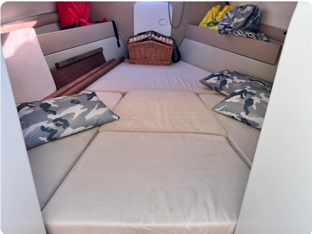
Boston Whaler 22 REVENGE