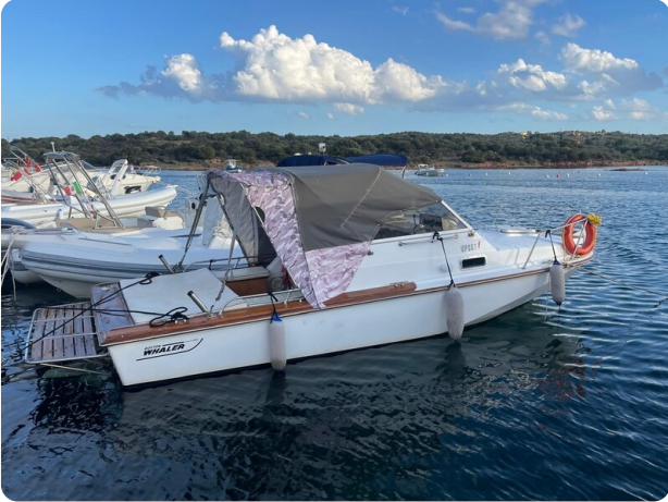
Boston Whaler 22 REVENGE