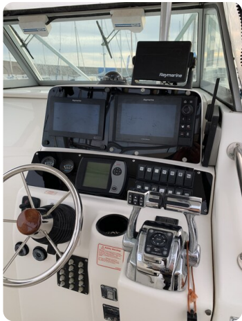
Boston 28 Outrage helm station