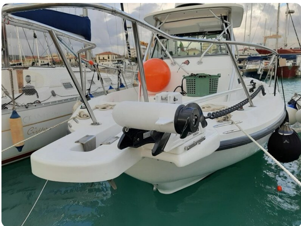
Boston 28 Outrage bow detail