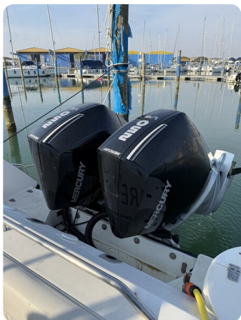
Boston 28 Outrage new engines