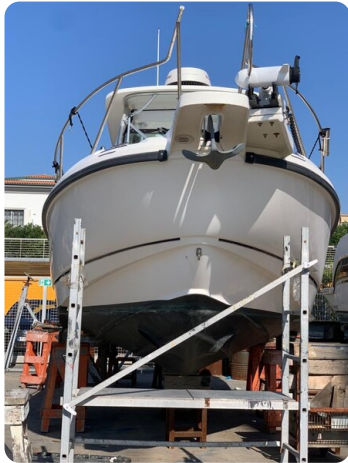
Boston 28 Outrage hull view