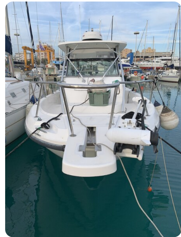
Boston 28 Outrage bow view