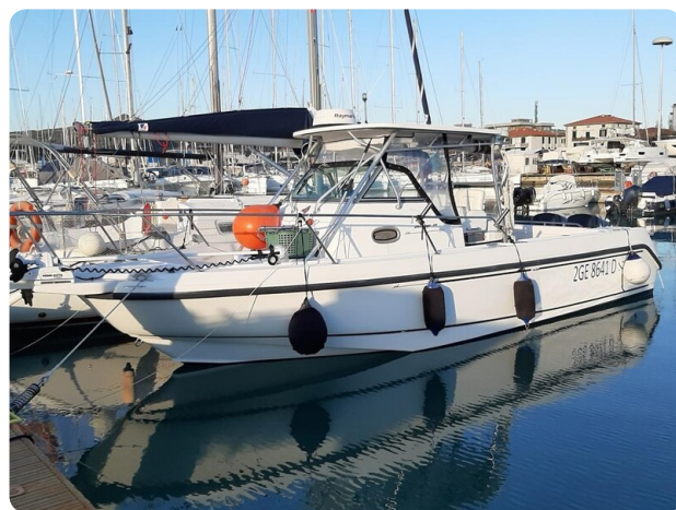
Boston 28 Outrage profile