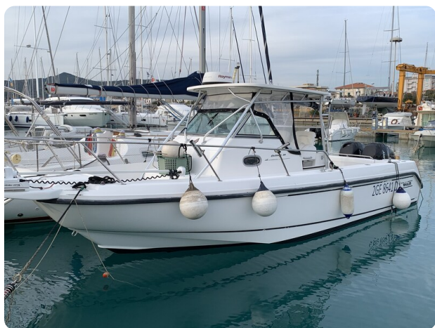
Boston 28 Outrage bow profile