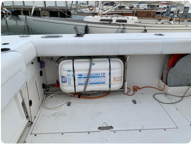
Boston 28 Outrage cockpit details