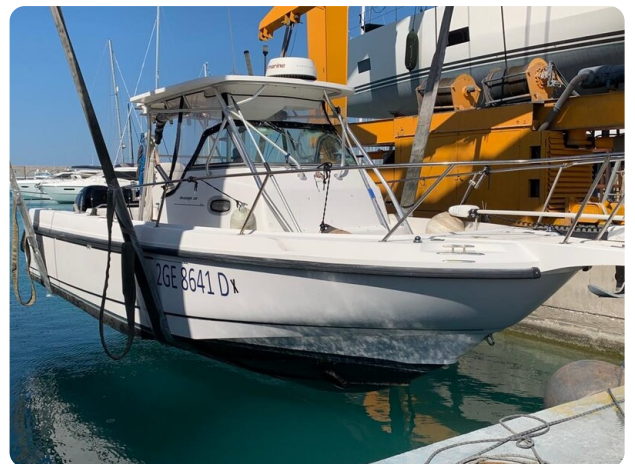
Boston 28 Outrage bow view