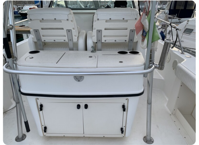
Boston 28 Outrage cockpit detail