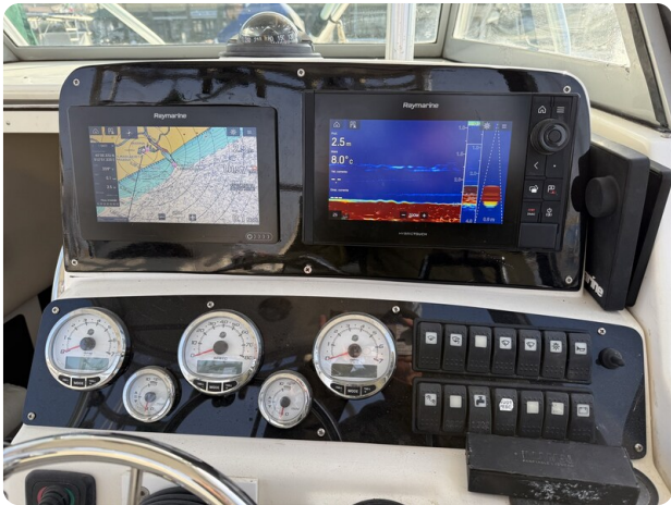
Boston 28 Outrage helm detail