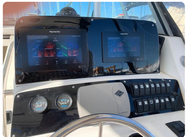
Boston 28 Outrage helm