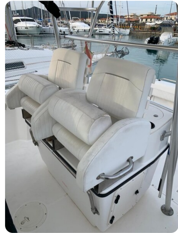
Boston 28 Outrage helm seats