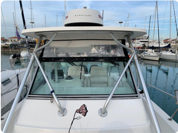
Boston 28 Outrage hard top detail