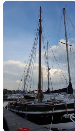
Bülthor Kutter msp625720 4