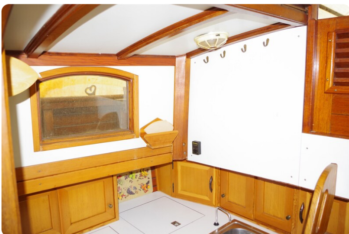
Bültjer Kutter msp625720 15