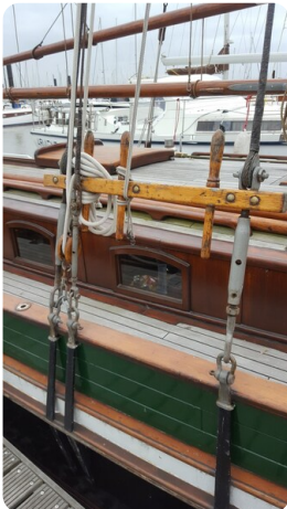
Bild3Bülthor Kutter msp625720 3