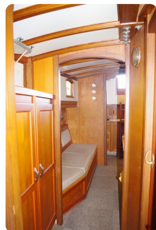
Bültjer Kutter msp625720 16