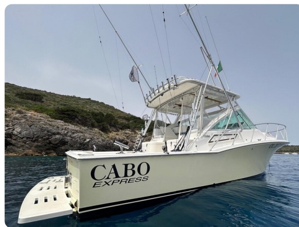
Cabo 32 Express, angle