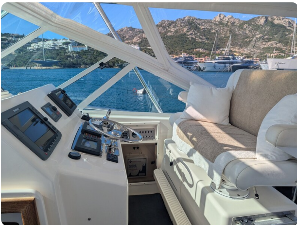
Cabo 38 Express helm station