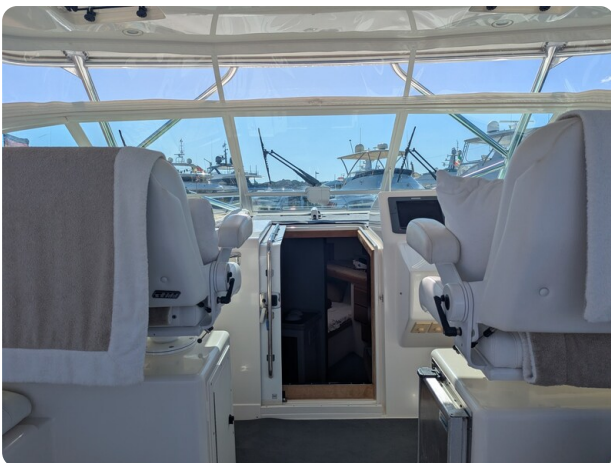
Cabo 38 Express upper cockpit