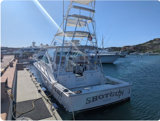
Cabo 38 Express stern view