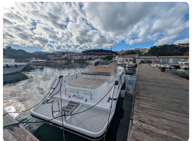
Canamer 33 aft view