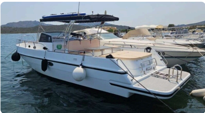
Canamer 33 aft profile