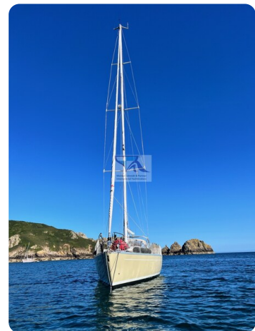
Grand Soleil 45 85