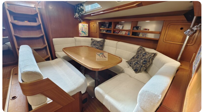
Grand Soleil 45 98