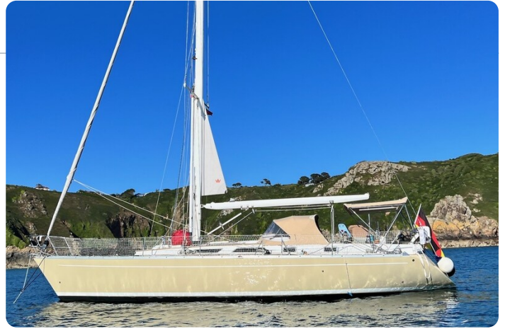
Grand Soleil 45 1