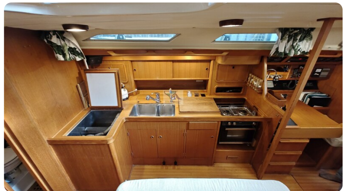
Grand Soleil 45 101