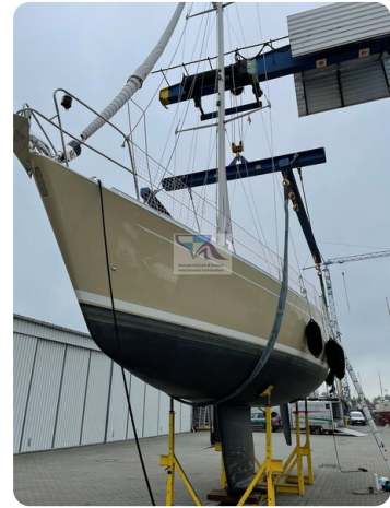
Grand Soleil 45 74