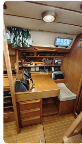
Grand Soleil 45 96