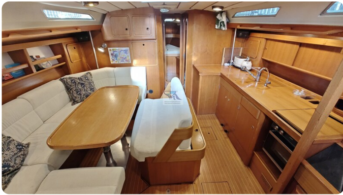
Grand Soleil 45 95