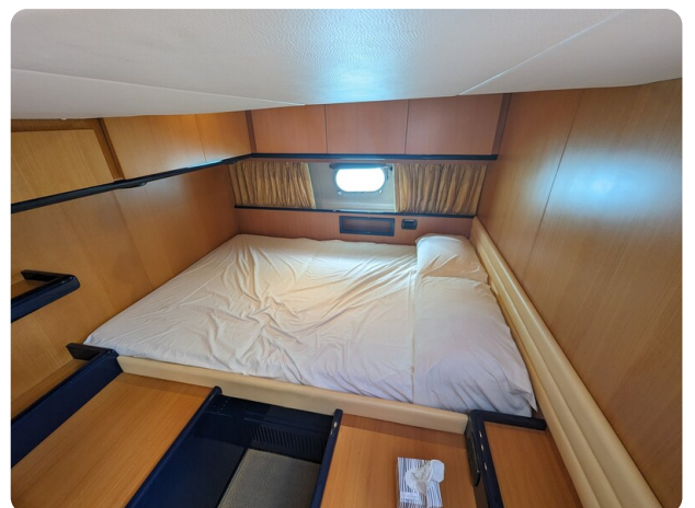
Cantieri di Sarnico 68 vip cabin