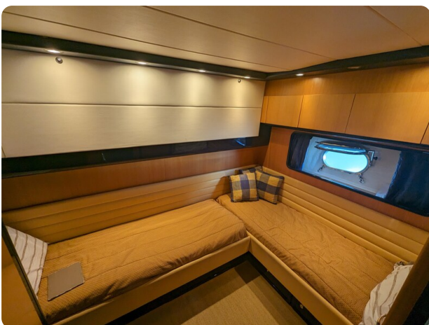
Cantieri di Sarnico 68 double cabin