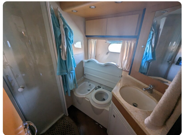
Cantieri di Sarnico 68 wc