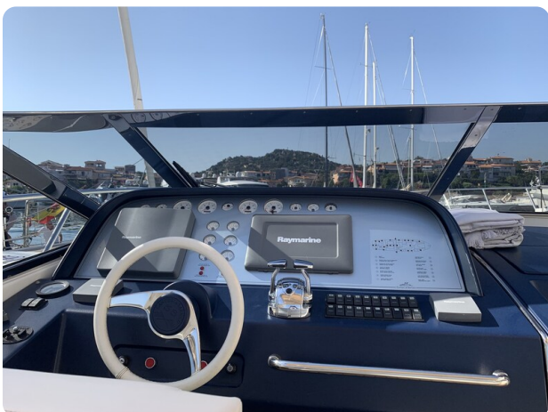
Sarnico 58 helm