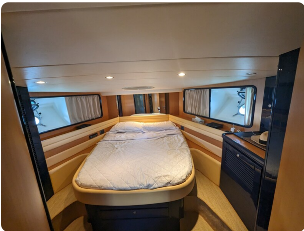
Cantieri di Sarnico 68 mastercabin