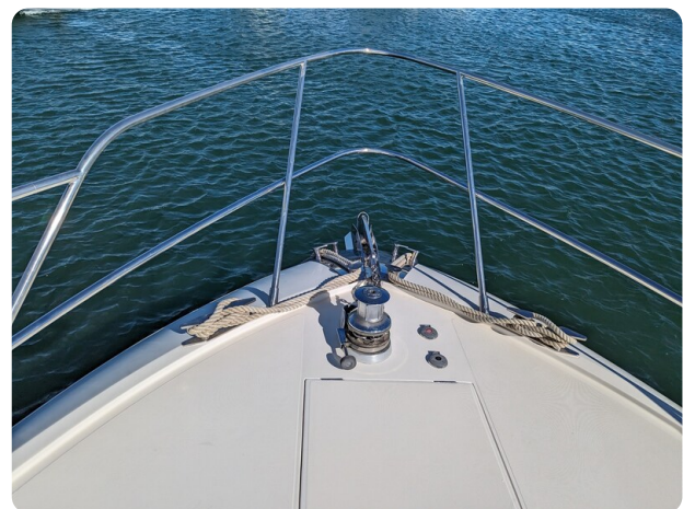
Cantieri di Sarnico 68 bow