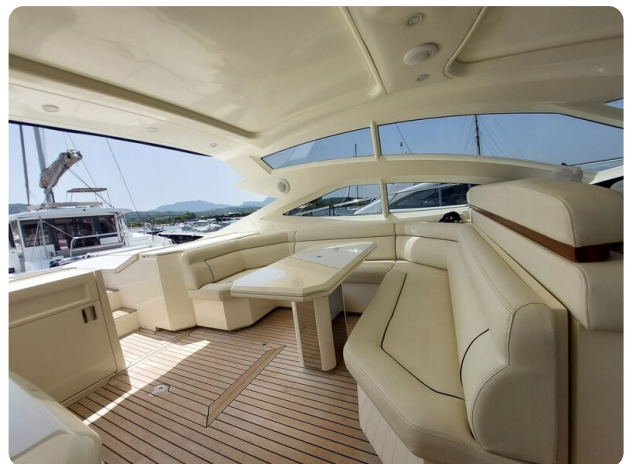
Sarnico 60 RiAl exterior dinette