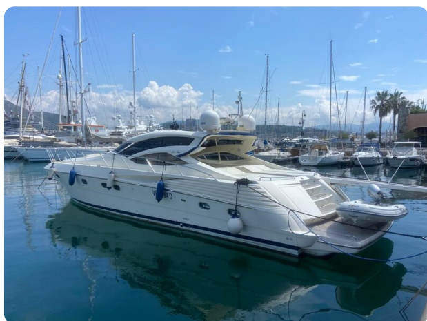
Sarnico 60 profile