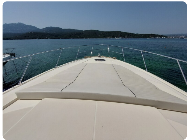
Sarnico 60 RiAl bow