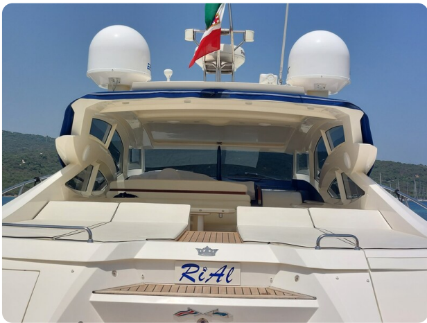
Sarnico 60 RiAl aft sunpad