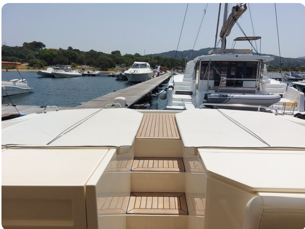
Sarnico 60 RiAl pics 122952