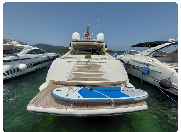
Sarnico 60 RiAl aft view