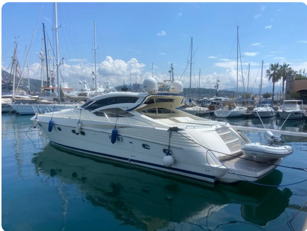
Sarnico 60 profile